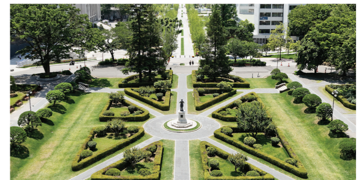
▲ 연세대학교 언더우드 홀

· 연세대학교 경영대학은 2024년 5월 AMBA (Association of MBA) 인증을 획득하여 AACSB, EQUIS 인증과 함께 경영교육 국제인증에 있어 Triple Crown을 달성하였다. · 미국 AACSB, 유럽 EQUIS, 영국 AMBA의 Triple Crown 경영교육 국제인증 획득은 국내 최초이자 유일하며, 세계에서 130번째 (세계 약 1%)에 해당한다. · 연세대학교 경영대학은 국내 KABEA 인증을 포함하여 4개의 경영교육 인증을 보유한 유일한 대학이 되어 국내를 넘어 세계적으로도 경쟁력을 갖추게 되었다.