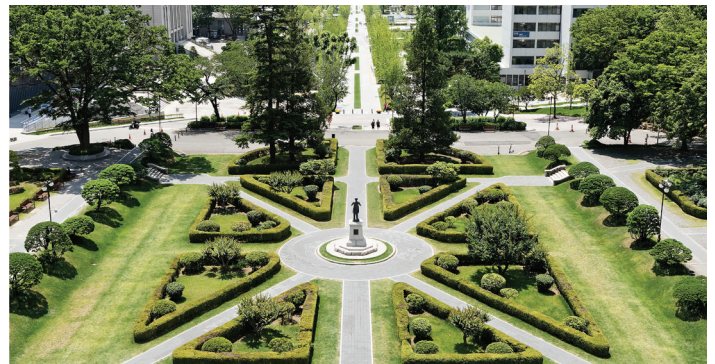
▲ 연세대학교 언더우드 동