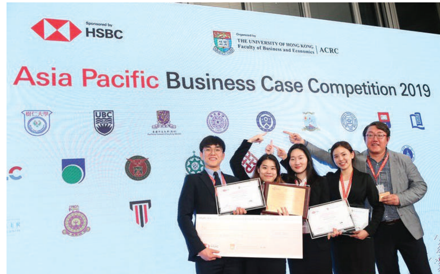
2019 HSBC/HKU Asia Pacific Case Competition에서 준우승을 차지하여 2년 연속 수상권에 진입한 연세대학교 경영대학 대표팀

세계 우수 학생들과 같이 국제적인 Business Case Competition을 거두면서 수업에서 배운 경영학적 마인드를 실제 적용해 보는 소중한 기회입니다. 연세대학교 경영대학은 학생들의 참여 기회를 넓히기 위해 Case Competition을 위한 지원 시스템을 갖추고 있습니다.