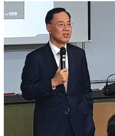
민원기 과학기술부 차관

학생들에게 영감을 줄 수 있는 연사를 초빙하여 벤처, 혁신, 창조, 4차 산업혁명을 주제로 개최하는 특강 시리즈입니다.