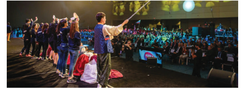
2016 인액터스 월드컵에서 세미 파이널에 진출한 Enactus

연세경영의 다양한 동아리와 학회는 학창시절의 즐거움, 그 이상의 가치를 가지고 있어 강의실에서는 얻을 수 없는 폭넓은 지식과 경험을 얻을 수 있습니다.