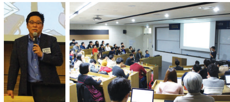
최세훈 카카오 부사장

학생들이 커리어 탐색 및 개발을 할 수 있도록 다양한 분야의 업계 선도자들의 현장감 있는 특강과 선배들과의 커리어 간담회입니다.