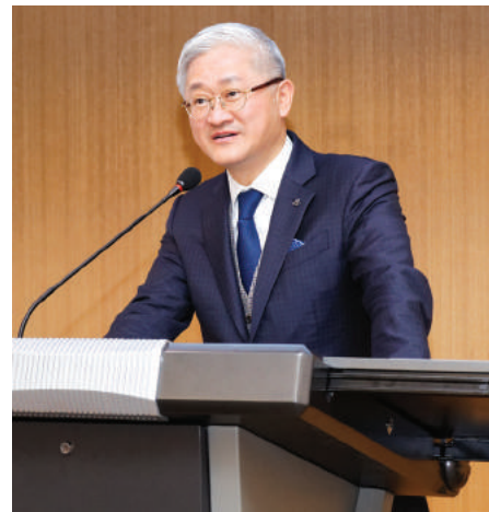
서경배 아모레퍼시픽그룹 회장 (경영 81)

대한민국을 선도하는 기업경영자들이 그들의 혁신성과 경영철학을 전하는 특강 시리즈입니다.