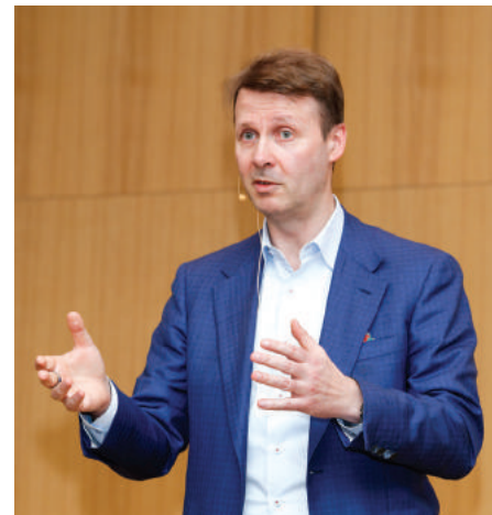
리스트 실라즈마 노키아 회장